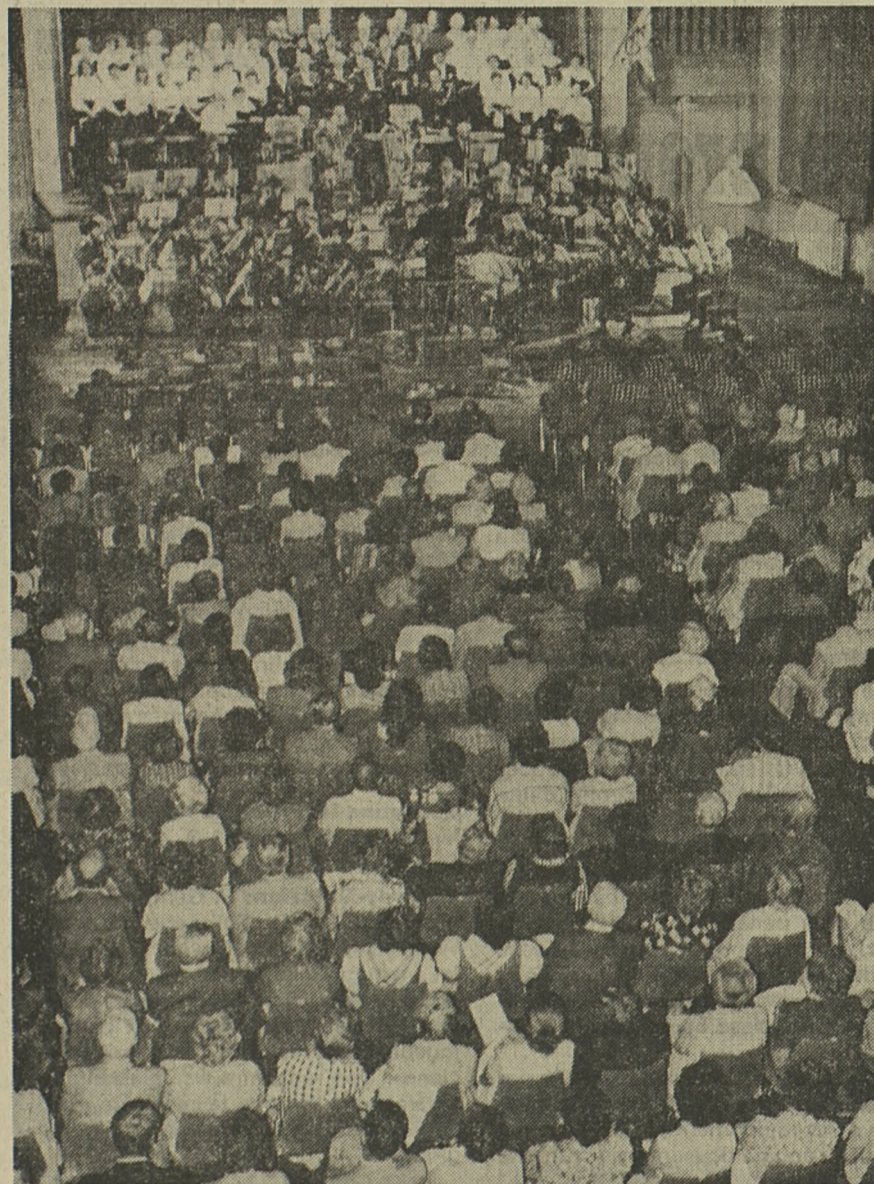
Une vue de l'immense foule venue applaudir l'Union chorale dans son interprétation des chœurs de la Fête de 1905. Tout au fond, les chanteurs et les musiciens de «La Lyre», soit quelque 130 exécutants.