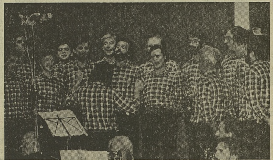
Le Chœur d'hommes de Rovereto (Italie du Nord), au cours de son concert présenté en première partie de la soirée au Casino du Rivage.